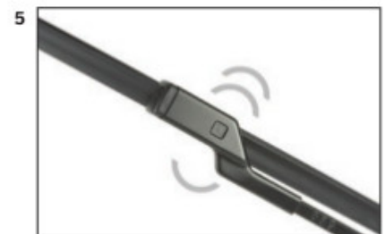
Montaż wycieraczek Bosch Aerotwin